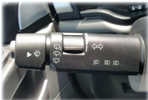
PRZEŁĄCZNIK WYCIERACZEK ŚWIAŁA DROGOWE KIERUNKOWSKAZY SYGNAŁ DŹWIĘKOWY