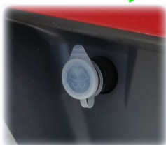
ZBIORNIK PŁYNU SPRSYKIWACZA SZYB