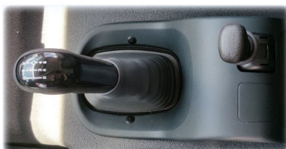
HAMULEC AWARYJNY DŹWIGNIA ZMIANY BIEGÓW