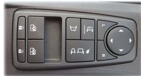
REGULACJA LUSTEREK ELEKTRYCZNE PODNIOSZENIE SZYB CENTRALNY ZAMEK