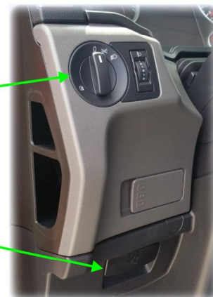
OTWIERANIE POKRYWY SILNIKA