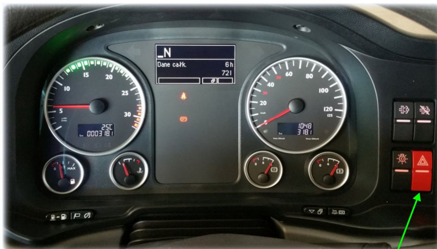
WŁĄCZNIK ŚWIATEL AWARYJNYCH